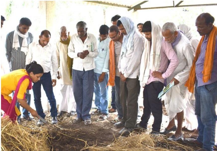
Composting By Compost Pit in Unnao

Other process for disposal includes: NADEP Pits.