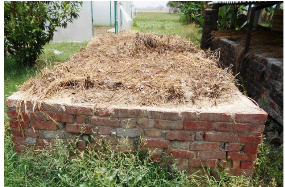
NADEP Pit in Unnao

अधिकासी अधकारी नगर पालिका परिषद, उन्नाव।